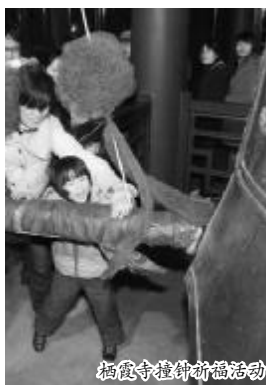
栖霞寺撞钟祈福活动