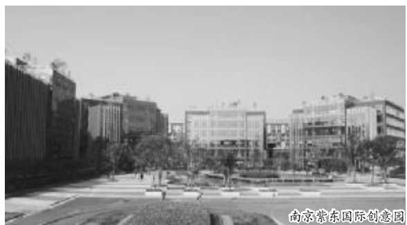
南京紫东国际创意园