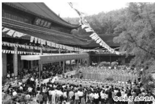
佛顶礼佛 盛世重光