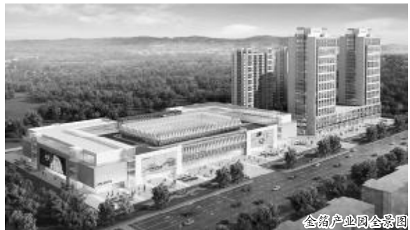
金箔产业园全景图